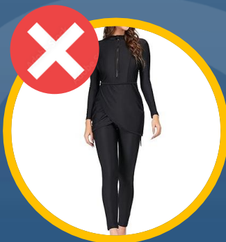
Lange mouwen en lange pijpen