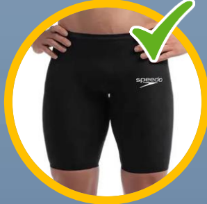
aansluitend met pijpen boven de knie