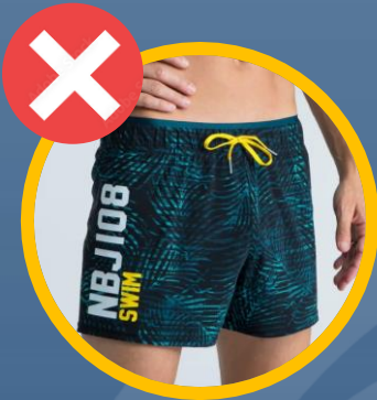
losse zwemshort in badstof