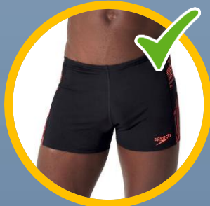
aansluitend met korte pijpen