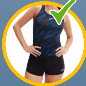
2-delig en aansluitend